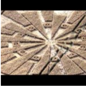
Un nouvel agroglyphe au Royaume-Uni