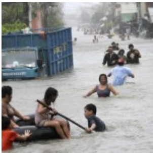
Philippines : le typhon Nesat fait au moins 23 victimes