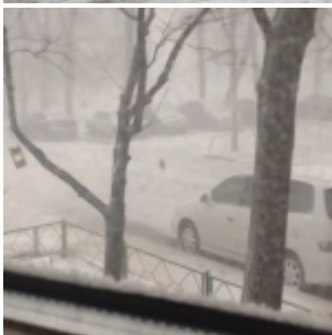
« Réchauffement » oblige : tempête de neige historique à Moscou