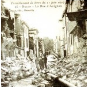
France : séisme de magnitude 5.0 dans le sud-est. Anodin? Pas sûr...