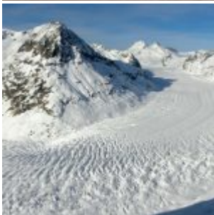
Recul des glaciers Alpains : quand les faits contredisent la thèse anthropique avancée par le GIEC