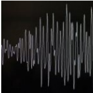
Puissant séisme de 6,2 dans le nord de l'Argentine