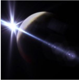
Mars-avril 2015 : météo extrême et autres joyeusetés