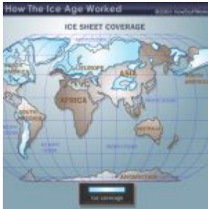
Des scientifiques annoncent 100 ans de refroidissement climatique