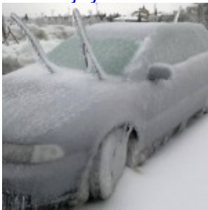
Slovénie : pire tempête de verglas de son histoire