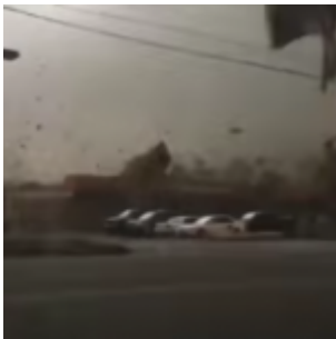
Septembre 2016 : conditions météorologiques extrêmes, météorites et autres joyeusetés