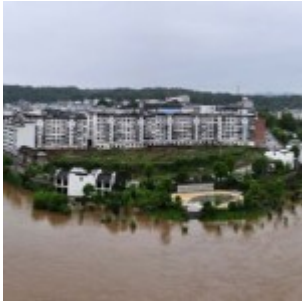
Planète inondations : Chine, Arabie Saoudite et France