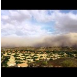
É.-U., Une nouvelle tempête de sable traverse l'Arizona

France : orages et grêle - 70,000 éclairs et jusqu'à 15 cm de grêle par endroit