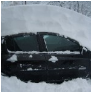
L'Autriche paralysée par une tempête de neige