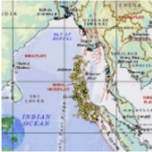
Indonésie : séisme de magnitude 6,7