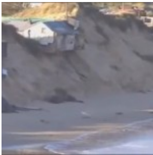
Décembre 2013 : météo extrême et phénomènes étranges