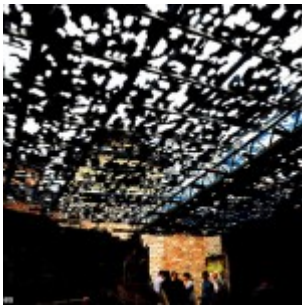
Chine : tempête de grêlons géants