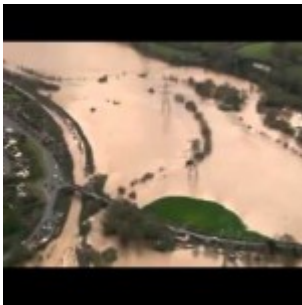
Inondations en Grande-Bretagne : 800 maisons inondées, 70 000 autres menacées