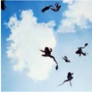
Pluies de grenouilles en Serbie

Des grenouilles pleuvent sur un village d'Alicante