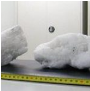
Des blocs de glace s'écrasent sur une maison canadienne