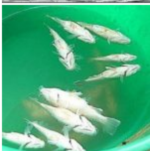
Il a plu des poissons sur le Territoire du Nord australien