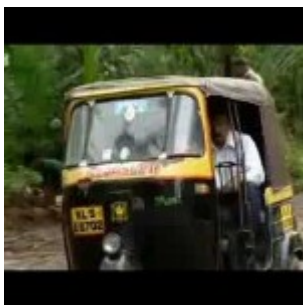
Pluie rouge en Inde

Des blocs de glace s'écrasent sur une maison canadienne