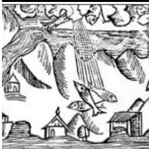
Le ciel nous tombe sur la tête... depuis toujours!