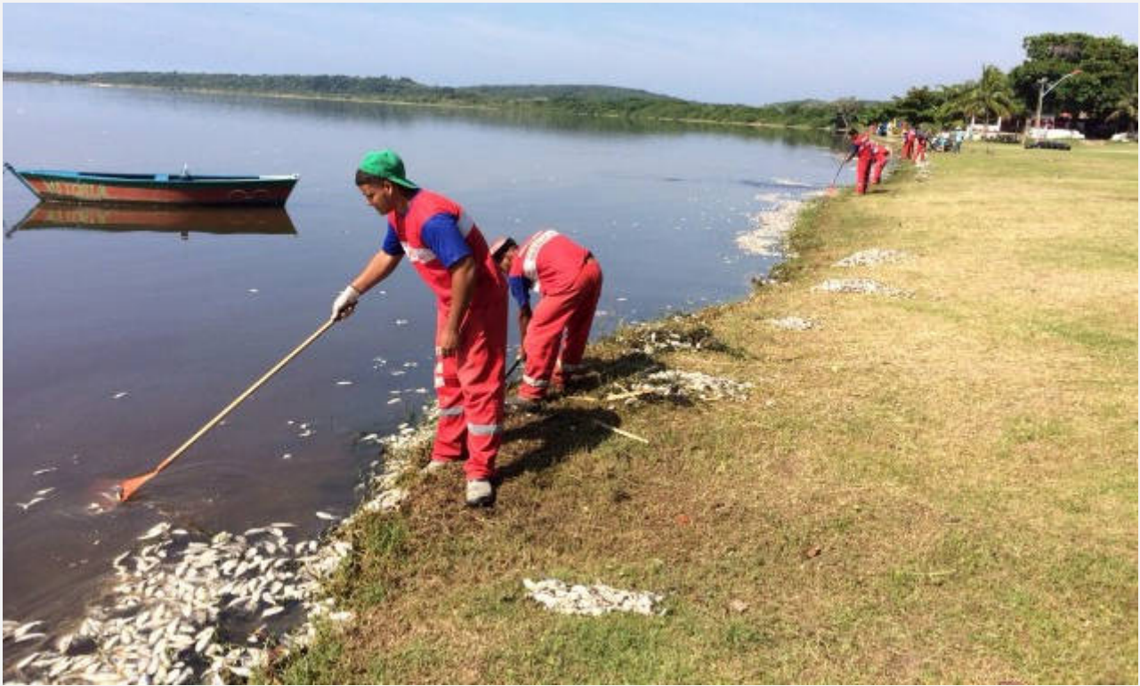
Prefeitura ainda retira peixes mortos