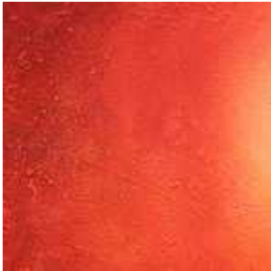
Des milliers et des milliers de poissons morts un peu partout dans les derniers jours