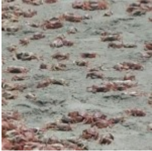
Chili : hécatombe de Crabes et autres espèces marines

France : au Havre, des centaines de poissons morts s'échouent sur la plage