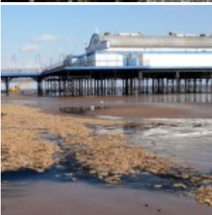
Angleterre : quatrième hécatombe d'étoiles de mer en un an