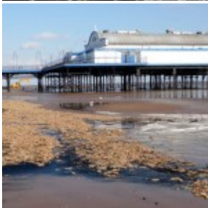
Angleterre : quatrième hécatombe d'étoiles de mer en un an