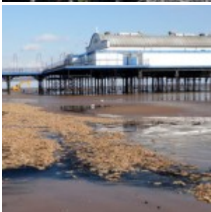
Angleterre : quatrième hécatombe d'étoiles de mer en un an