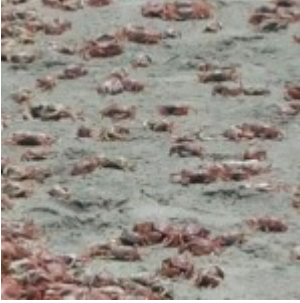
Chili : hécatombe de Crabes et autres espèces marines

France : au Havre, des centaines de poissons morts s'échouent sur la plage