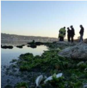
Hécatombes de poissons : la France et l'Inde s'ajoutent à la liste