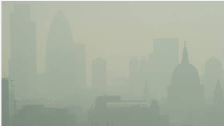
Cathédrale de Saint-Paul surplombant le nuage de pollution, Londres, Avril 2011

Ce sont 13,000 personnes qui meurent chaque année à cause de la pollution de l'air au Royaume-Uni, selon une étude du Massachusetts Institute of Technology. Une majeure partie de cette pollution est domestique puisqu'environ 60% de l'air pollué provient d'activités qui prennent place au Royaume-Uni.