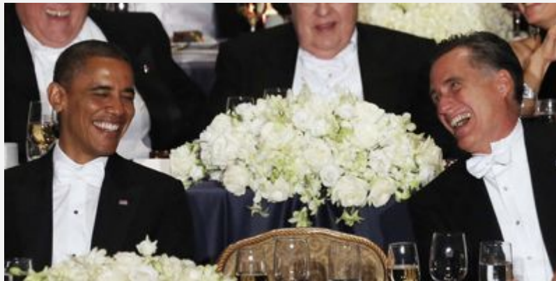
Lors d'un gala de charité, les deux principaux candidats à l'élection présidentielle US affichent leur proximité.

Au cours des 30 dernières années, aucune élection présidentielle US n'a marqué de changement dans la politique extérieure de Washington. Les décisions importantes ont toujours été prises en dehors de cette échéance. Il est tout à fait évident que le président est le maître d'œuvre d'une politique dont il n'est pas le décideur. L'impérialisme yankee sera-t-il plus performant avec le sourire d'Obama ou avec celui de Romney ?