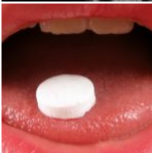
Créativité et non-conformisme désormais une maladie mentale