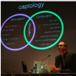
Facebook utilise la « captology » pour influencer ses moutons numériques