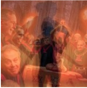
Culte pédo-satanique chez des militaires US et personnalité multiple