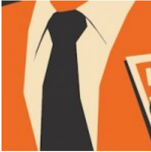
Les techniques « secrètes » pour contrôler les forums et l'opinion publique