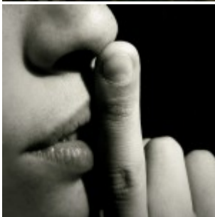
États-Unis : les jeunes californiens de 12 ans seront vaccinés sans que leurs parents en soient informés.