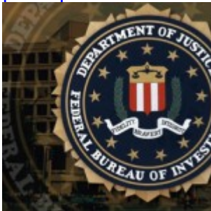
Le FBI organise presque tous les complots terroristes aux États-Unis