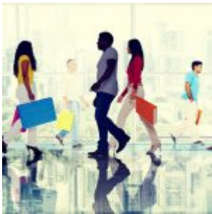
Noam Chomsky - Fabriquer des consommateurs