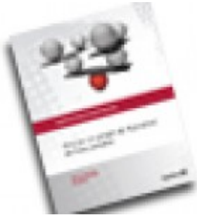
Nouveau projet de fluoration de l'eau au Québec