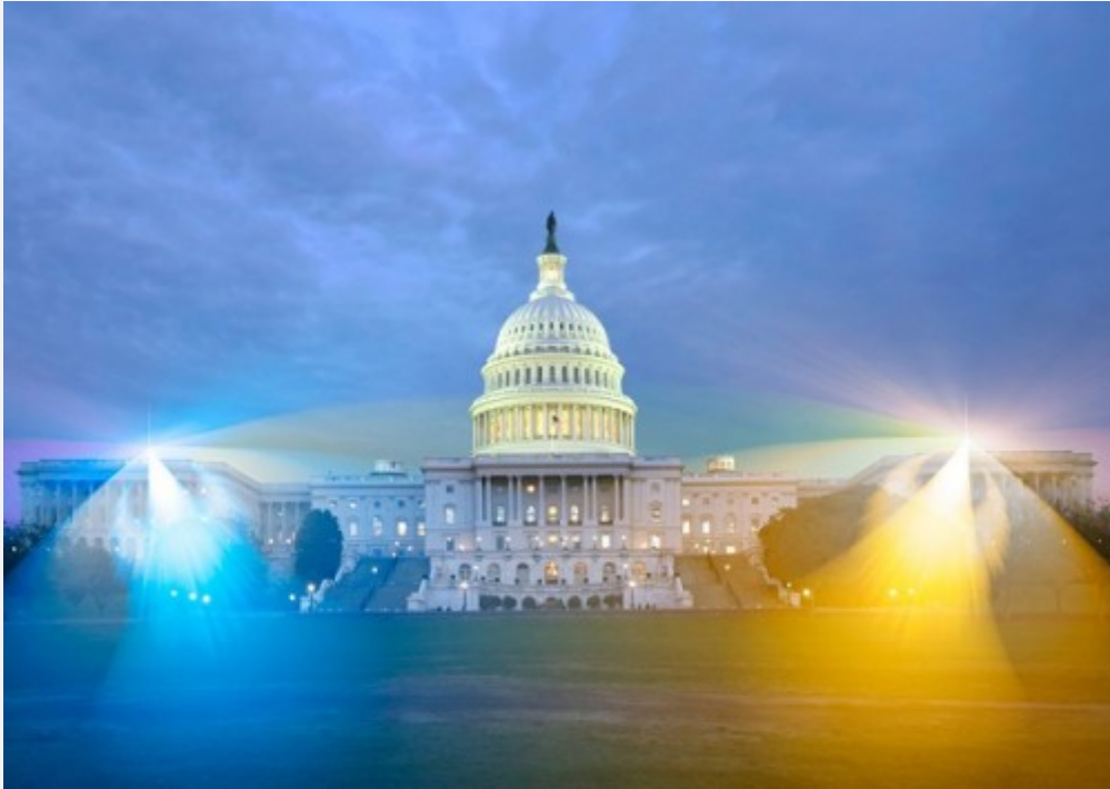
Le Capitol représenté par Nickolay Lamm

Et si les ondes des antennes téléphoniques étaient visibles?