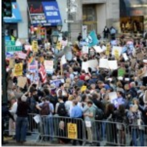
Arrestation de 129 manifestants à Boston