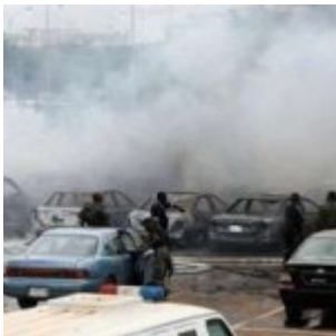
Nigeria : attentat à Abuja et violentes attaques armées dans le nord du pays