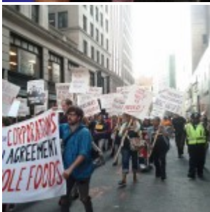
États-Unis : le mouvement Take Back Boston réprimé lors d'une manifestation devant une banque