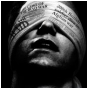
Triomphe de la propagande : les médias, armes de guerre