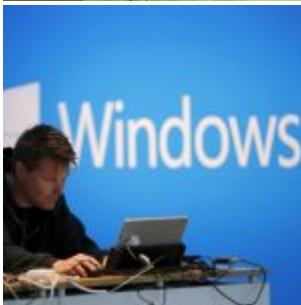
Windows 10 accusé de violer la loi sur les données personnelles