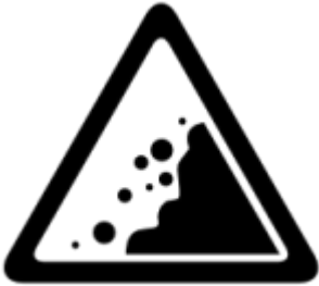
En bref - Glissement de terrain meurtrier en Ouganda