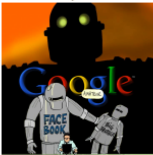
Google [et les autres] vous traque sans votre consentement