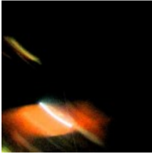
Des ovni triangulaires filmés aux Philippines