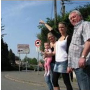
En France (à Toufflers) ils ont vu des choses étranges...