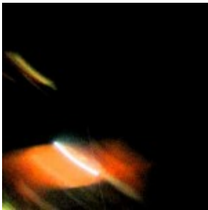
Des ovni triangulaires filmés aux Philippines