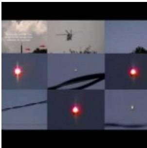
Un ovni lumineux, suivi de trois hélicoptères, filmé en Floride