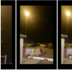
France : trois boules lumineuses (ovnis) filmées dans le ciel de Cagnes-sur-Mer