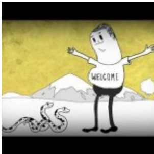
L'homme est-il le vrai prédateur sur Terre?