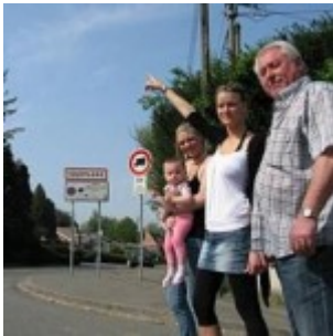
En France (à Toufflers) ils ont vu des choses étranges...