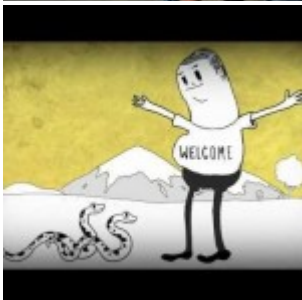
L'homme est-il le vrai prédateur sur Terre?