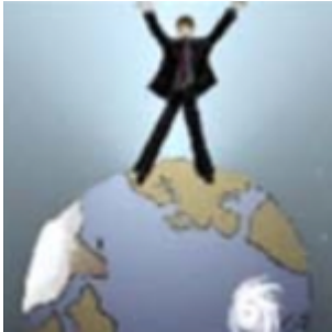
L'ego humain : seul dans l'Univers!