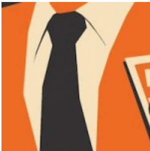
Les techniques « secrètes » pour contrôler les forums et l'opinion publique