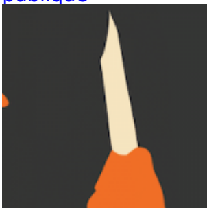
Flashback - les techniques « secrètes » pour contrôler les forums et l'opinion publique