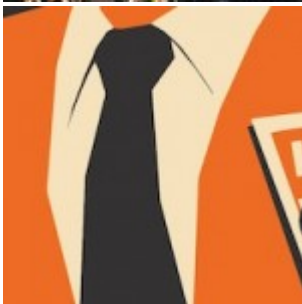
Les techniques « secrètes » pour contrôler les forums et l'opinion publique