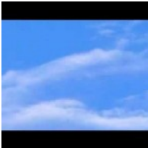
Observation d'onvi en forme de cigare à Chimbote