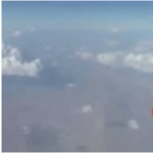
Iran : un passager d'avion de ligne filme un ovni