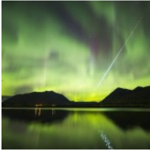
Planète météores : Canada(3), Brésil(3), Japon(3) et Russie(1)