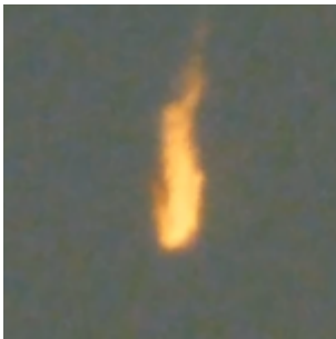
Planète météores : France(2), Canada, Finlande, Mexique, États-Unis(3), Japon(3)