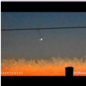
Boule de feu et ovni dans le ciel du Kazakhstan