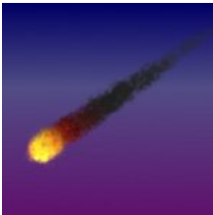
Une boule de feu observée dans le ciel au Royaume-Uni