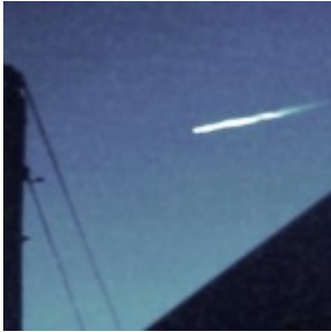
États-Unis : un météore filmé en plein jour donne naissance à... un ovni